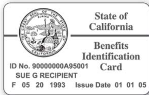
Su tarjeta de Medi-Cal