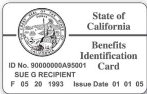
Thẻ Medi-Cal của quý vị

Để được trợ giúp hoặc để biết thêm thông tin: