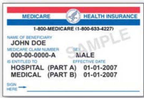
您的 Medicare 卡

大多数拥有完整 Medicare 和完整 Medi-Cal 的人员均可加入该计划。您可以通过所持卡片的类型来辨别您是否拥有 Medicare 和/或 Medi-Cal：